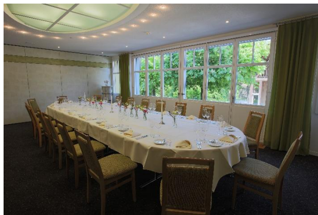
Hofstube bis 30 Personen