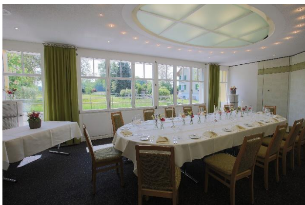
Brunnenstube bis 20 Personen

Gebratenes Wolfsbarschfilet Hausgemachte Ravioli CHF 46.--