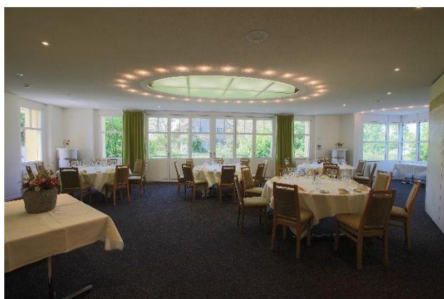
Bachstube bis 40 Personen