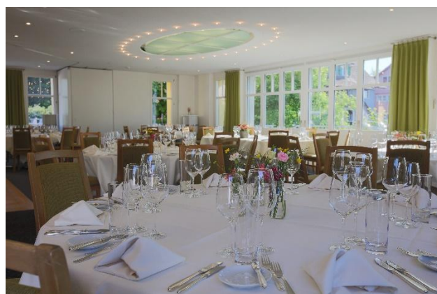
Saal offen bis 120 Personen